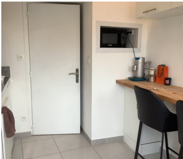
Charmant Studio Meublé à Templemars

Découvrez ce jolie petit studio meublé avec gout, situé au rez-de-chaussée de la commune paisible de Templemars, à deux pas de Wattignies et à proximité immédiate du CREPS, idéal pour les étudiants ou les jeunes professionnels.